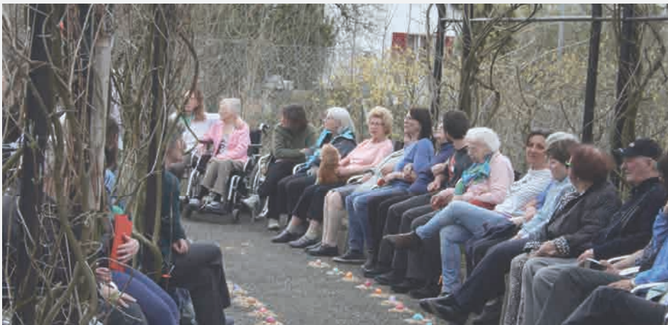
Spezialisierte Wohngruppen für Menschen mit Demenz