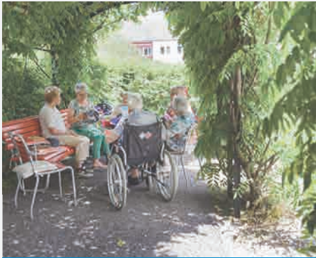
Grosszügige, speziell auf die Bedürfnisse von Menschen mit Demenz angelegte Gärten