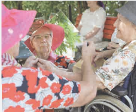
Demenzgerechte individuelle Betreuung und Pflege in einem spezialisierten Umfeld