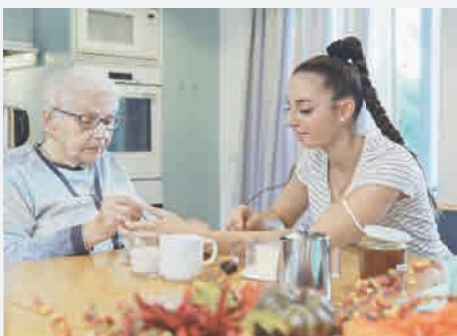
Verbindung der Zimmer über die grosszügig ausgelegte Begegnungszone mit der geräumigen Wohnküche und der Stube