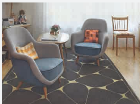
Einzel- und Doppelzimmer mit Dusche und WC